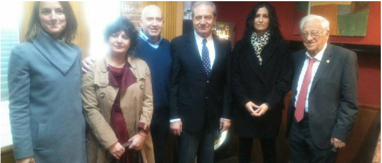
Foto de familia de representantes de la Fundación SEUR, Bienvenidos Refugiados España, Mensajeros de la Paz y de la Fundación Atresmedia, tras la firma del acuerdo de colaboración en la campaña humanitaria para Lesbos.

Bienvenidos Refugiados España, en colaboración con la Fundación SEUR, Mensajeros de la Paz y Atresmedia, envía el próximo 27 de noviembre todo el material donado en 19 puntos de España, Francia y Portugal